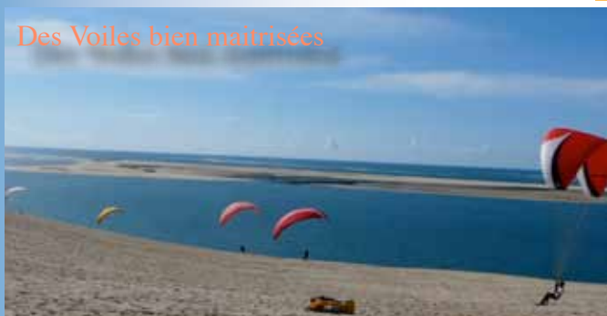
Des Voiles bien maîtrisées